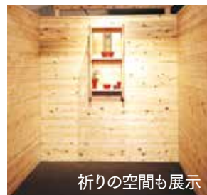
祈りの空間も展示