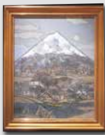
作品名『早春の富士山』 1977年(昭和52年) (軽井沢 田崎美術館 所蔵)

日本一の高さを誇る富士山は、同時に日本を象徴する山であり、数多くの画家たちを魅了し描かれてきました。田崎廣助画伯もまた、富士に魅了された一人です。画伯は、1973年(昭和48年)ブラジル・日本の両国で開催された第1回日伯現代美術展の開催にあたり、東郷青児らと共にブラジルとの美術交流、友好親善に尽力。その功績が認められ最高名誉章・文化章であるグラン・クルーズ章、コメンダドール・オフィシアル章