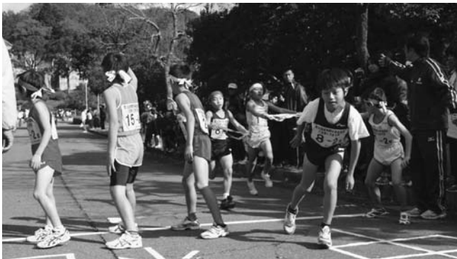
たすきをうけ走りだします