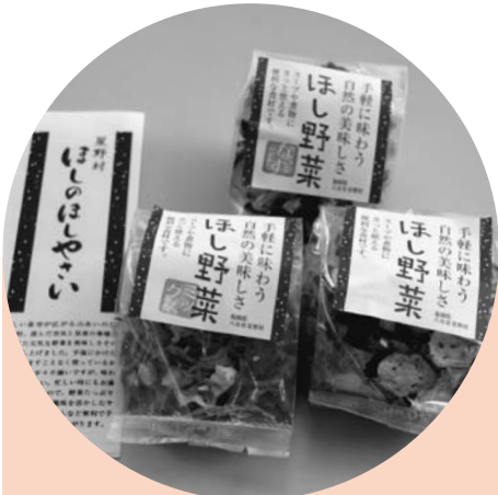
▲なすとみそ汁の具とおふくろめしの主力商品の3品