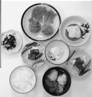
自然薯を使った料理がずらり