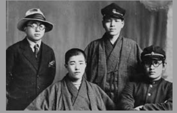
文人絣を着た昭和4年当時の学生