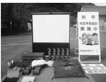
今回整備された備品