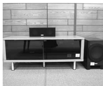
BDレコーダーとスピーカー一式