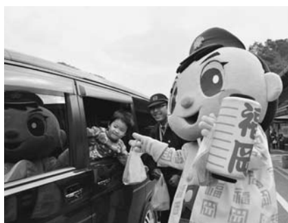
ふっけい君も交通安全を呼びかけました

今回は八女市の観光ピーアールを務める八女津媛や、福岡県警のマスケットキャラクター「ふっけい君」も参加。道の駅たちばなに来た買い物客に対し、交通安全を呼びかけました。