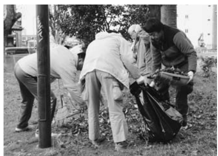
清水公園の落ち葉もきれいになりました

市内の3か所に分かれて、清掃活動を希望した人が公園などのごみや落ち葉を拾い集めました。施設利用者の頑張りにより2時間足らずできれいになりました。皆さんお疲れさまでした。