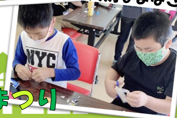
しんけん 真剣なまなざし

10月2日(土) やめしりつとしょかん こうどう としょかん よ 八女市立図書館(やめしりつとしょかん)と合同(こうどう)で、図書館まつり(としょかん)をしました。読み き じかん ものがたり ひ こ 聞かせ(き)の時間(じかん)はみんな物語(ものがたり)にどんどん引き込まれるよう に、夢中(むちゅう)で聞いて(き)いました。工作(こうさく)ではムカデ(むかで)やてっぽう(てっぽう)の おもちゃ(おもちゃ)を作(つく)って何回(なんど)も遊(あそ)んで、おうち(うち)の人(ひと)を驚(おど)かせた よ(よ)！とみんな喜(よろこ)んでもって(もって)かえ(かえ)りました。