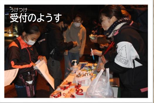
うけつけ 受付のようす

よ あ まえ しゅうごう はじ さんかしゃたち 夜明け前に集合し始めた参加者達。 しっかり たいちよう と体調を整え、待ちに待った ま この日 ひ を迎えることができました!