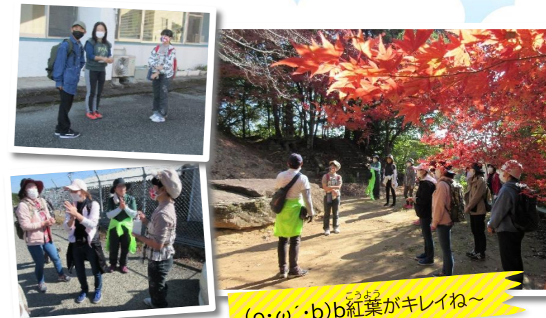
(o・w・b)b紅葉がキレイね～

20日(土) 公民館講座のサポーターとして参加し、八女オルレのコースと一緒に歩きました。 途中ハプニングで、蜂の巣を避けたり、土砂崩れを迂回したりと…。本来11kmのコースが19kmほどになっていました！ しかし、みなさん無事完歩。よく頑張りました～！