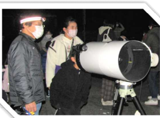
▲大きな望遠鏡で、子どもたちと月の観察。

市民のみなさまのさまざまな活動に、登録ボランティア（個人・団体）の派遣を行います。地域活動のお手伝いができますようご相談お待ちしております。下記の問い合わせ先まで、お気軽にご連絡ください。詳しくは、八女市のホームページにも掲載しています。