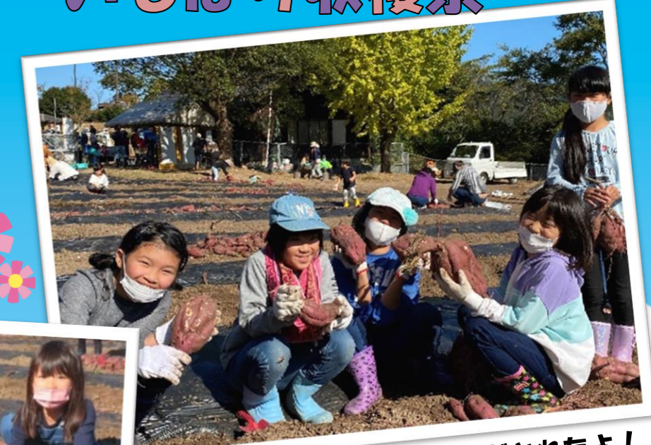
こんなにおおきなサツマイモがとれたよ！