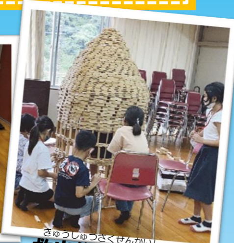
きゅうしゅうつさくせんかいし 救出作戦開始！

11月7日(日) むら い あおぞら ようき いもほり村(むら)に行って、青空(あおぞら)でぼかぼか陽気(ようき)のな か、さつまいも掘り(ほ)をしました。いもの重さ(おも)を競(きそ) うイベント(い)では、2位(に)にランクイン(い)！その場(ば)で焼 き芋(いも)を食(た)べてほっこり(にち)した1日(いち)でした。