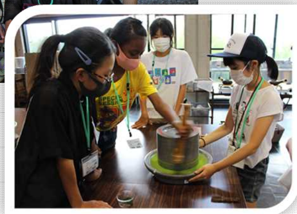
▲茶の文化館で、石臼抹茶ひき体験。

7月29日から30日の2日間で市内の施設を巡り、抹茶ひきやぶどう狩りなどさまざまな体験学習を通して、八女市の文化、歴史、産業に触れ、新たな魅力を見しました。参加した6年生15人は、1泊2日を一緒に過ごすことで、新しい友達もできたようです。