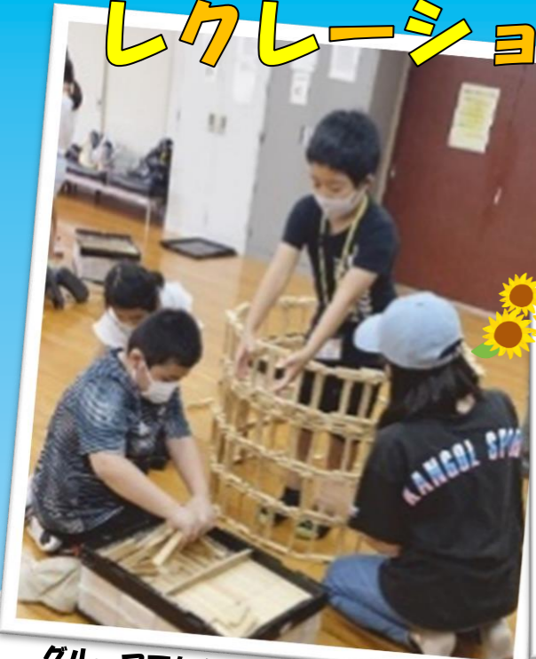
グループでちからをあわせるよ！

7月17日(土) れいわ ねんど こうざせい 令和3年度スターキッズ講座生みんなで、 かいこうしき しよちょう はなし き 開講式をしました。支所長のお話を聞いた あとは、それぞれが1年間(ねんかん)でどんなことを がんば(き)頑張るのか決めました。そのあとは、カブ つ(き)積み木(しる)でお城(つく)を作りました。