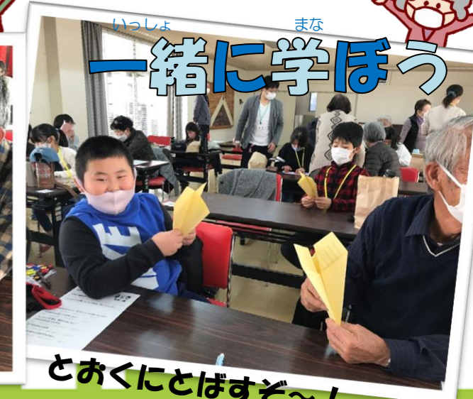
とあくにとぼすぞ〜！