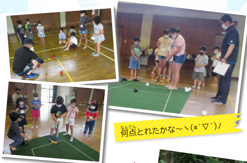
なんてん 何点とれたかな～(*▽*)

26日(土)「パタンク」と「囲碁ボール」をスポーツ推進員の方々に指導していただきました。 どちらの競技も初めての講座生が多く、推進員の方々の指導で、投げ方や打ち方がみるみる上手くなって接戦になり、とても盛り上がりました！ お掃除もすすんで楽しくできました☆