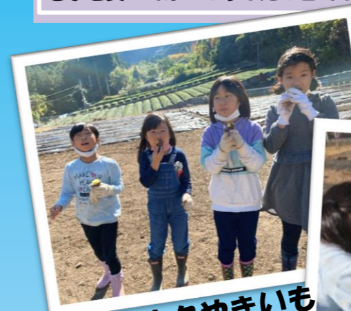
ホクホクやきいも

11月7日(日) むら い あおぞら ようき いもほり村(むら)に行って、青空(あおぞら)でぼかぼか陽気(ようき)のな か、さつまいも掘り(ほ)をしました。いもの重さ(おも)を競(きそ) うイベント(い)では、2位(に)にランクイン(い)！その場(ば)で焼 き芋(いも)を食(た)べてほっこり(にち)した1日(いち)でした。