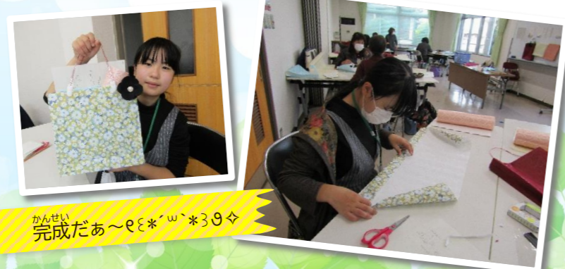
かんせい 完成だあ～εε*´ω`*39

11日(土) 公民館講座に参加しました。 講座生の参加は1人でしたが、公民館講座の参加者の方とも協力しながら作ることができました。 コツを掴みスイスイと、素敵な手作りバッグが完成していました♪