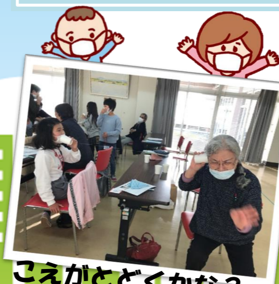
こえがとどくかな？