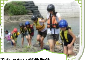
手をつないだ救助法