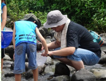
7月21日(月・祝)星野川水辺教室