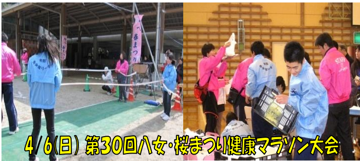
4/6(日) 第30回八女・桜まつり健康マラソン大会