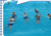
ペットボトルで浮く体験