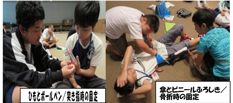
ひもとボールペン/突き指時の固定