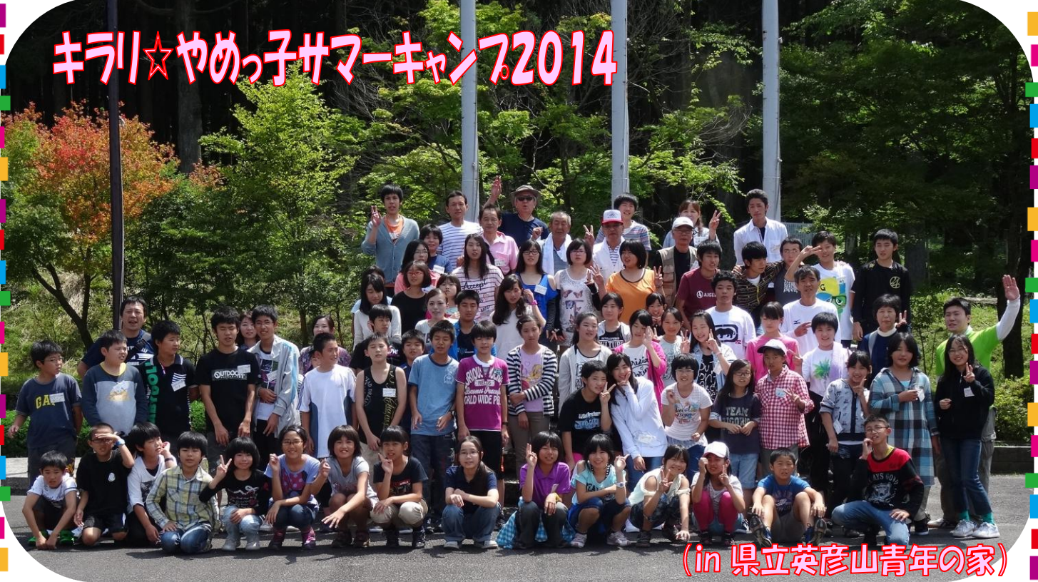
(in 県立英彦山青年の家)

7月25日(金)～27日(日)に『キラリ☆やめっ子サマーキャンプ(八女市青少年教育キャンプ)』を県立英彦山青年の家で実施しました。