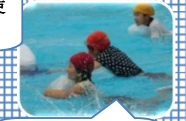
ビニール袋で浮く体験