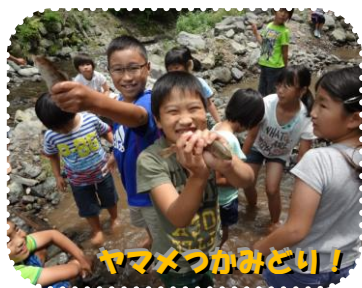
ヤマメつかみどり!