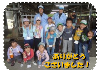
ありがとう ございました!