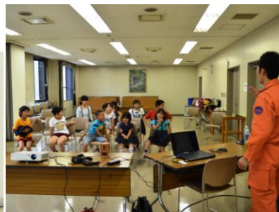
▲7/14(月) 八女東消防署矢部分署 救急教室