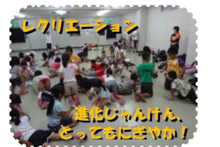
進化 しゅうか じゃんけん、どっちもにぼやか!