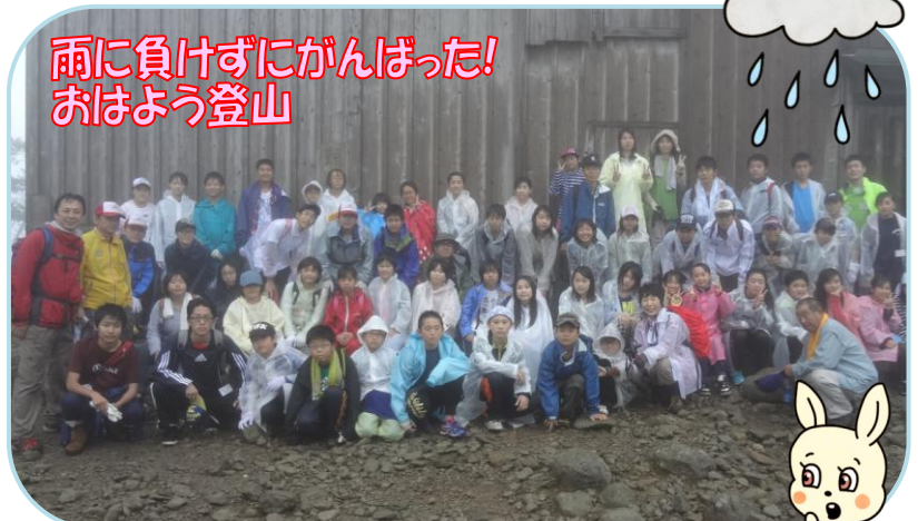
雨に負けずにがんばった！おはよう登山

どの班も道に迷ったり課題に悩んだりしながらゴールを目指しました！ハトハトだったけど楽しかった様子でした。