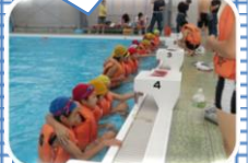
ライフジャケット着用法