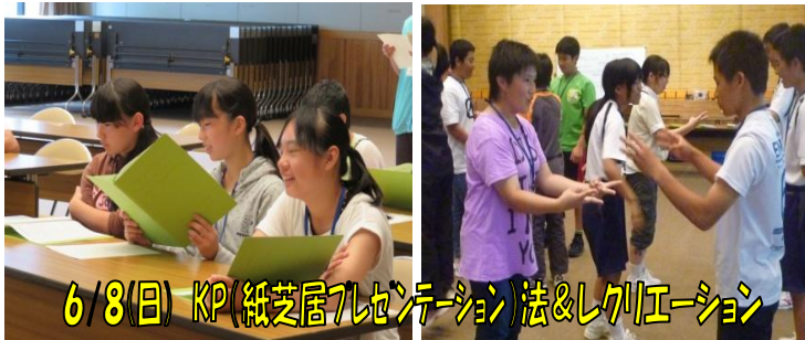
6/8(日) KP(紙芝居7レクレーション)法&レクレーション

7/6(日) ファーストエイド 「救急時、どうしようもない時、薬屋さんがいないとき…あなたは どうしますか？」実は、自宅にある身のまわりのモノをつかって固定法・止血法・運搬法ができるのです！お試しあれ。