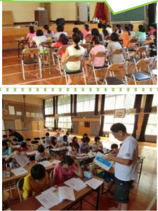
川の危険個所の説明