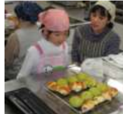
ぱんやさんみだいに、おいしいパンができました！