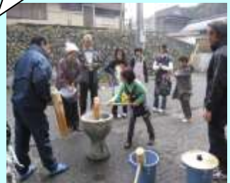
調理実習 11月28日(月) [1~3年生・10名]