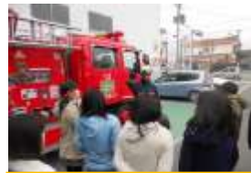
12月10日(土) 災害に備えよう