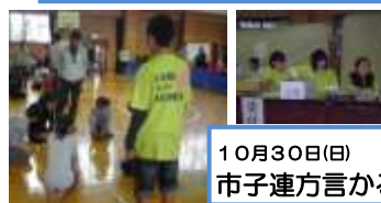
10月30日(日) 市子連方言かるた会サポート