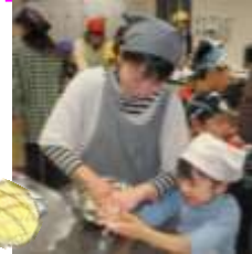
第3回【1月14日(土)】親子deわくわくぱんやさん