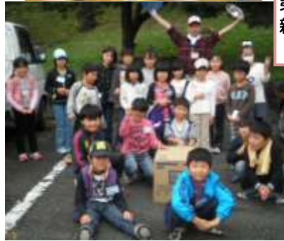
ダッチオープン料理、段ボール箱を使った燻製作りに挑戦しました！