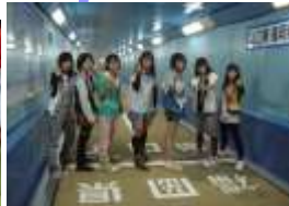
九州脱出大作戦！ 関門トンネルを歩いて福岡県から山口県へ！