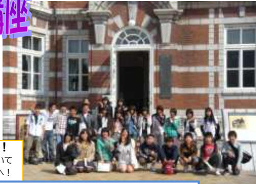
9月24日(土) バスハイク in 北九州 & 下関