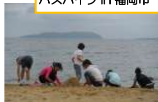
福岡市は、大きくてわくわくドキドキがいっぱいでした！