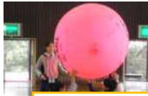
11月19日(土) ニュースポーツに挑戦