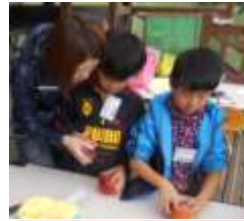
第2回【11月3日(土)】親子deわくわくミニキャンプ