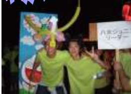
9月24日(土) あかり絵パレード参加