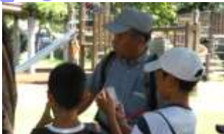
9月17日(土) ふるさと写真館