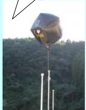
9月24日(土)・10月10日(月)の2日間かけて制作しました。 [参加者29名]