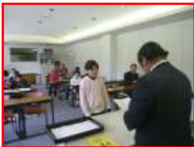
閉講式〔認定証授与式〕

閉講式では、12名の子どもたち一人一人に八女市子ども会育成連絡協議会より、初級インリーダーの認定証が交付されました。その後、みんなでオリジナルのピザ作りに挑戦しました。自分でピザ生地をのって、その上に具材をのせてフライパンで焼いて独自のピザを作りました。楽しい雰囲気の中で全ての講座を修了する事ができ、子どもたちも満足だったようです。