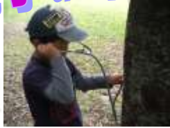
聴診器を使って木の鼓動を聞いてみよう