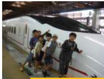
10月15日(土) バスハイク in 福岡市