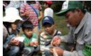
第1回【10月1日(土)】親子deわくわく探検隊