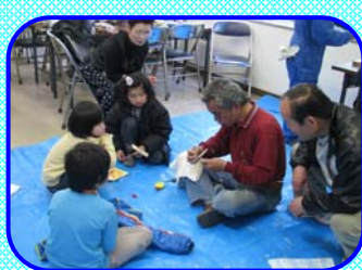
4月4日 木工教室【竹とんぼづくり】