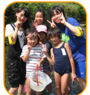
町内の中学生・高校生がサポーターで大活躍中！