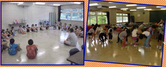
6月11日 開講式【レクリエーション】

今年度、年間を通したふるさと探検キッズ講座(小学4年生から6年生を対象)を開設しました。24名の仲間と活動しています。その他にも春休み・夏休み・冬休みにいろいろな体験活動を計画しています。