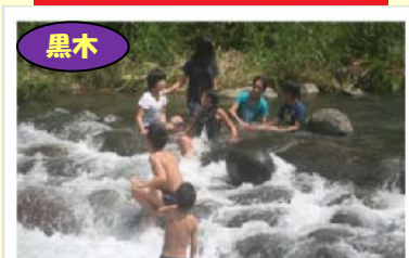
黒木 きのこ村キャンプ場で川遊び