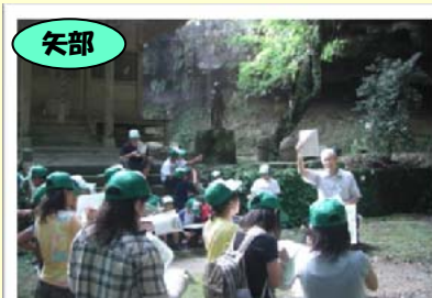
矢部 八女津媛神社で「八女の地名の由来」を学習