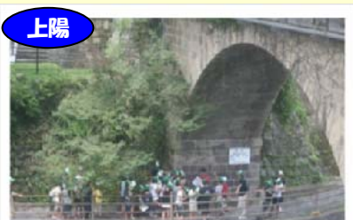
上陽 ほたと石橋の館で石橋を見学