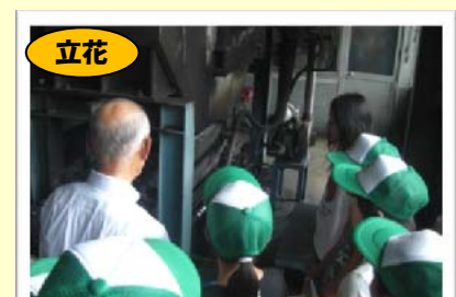
立花 立花バンブーで竹炭工場を見学