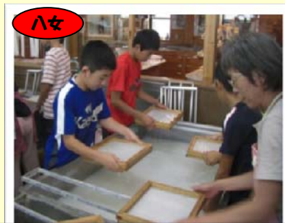
八女 八女伝統工芸館で手すき和紙を体験

八女市をぐる〜っとめぐり市内各地での取材・体験をとおして、郷土八女のよさを再発見したり、学校の垣根を越えて新しいなかまと交流することができました。