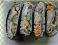
朝食は“おにぎらず”