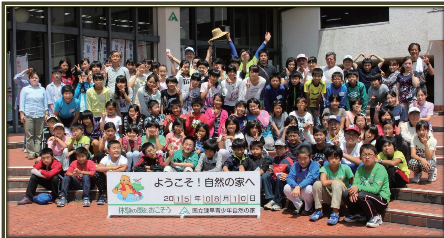
ようこそ! 自然の家へ 2015年08月10日 体験の風をおこそう 国立諫早青少年自然の家

参加した69名の小中学生は、3日間いろいろな野外体験活動を行いました。野外調理では、まきを割って火をおこし、羽釜でごはんを炊きました。沢登りでは、急な岩場で手をとり合ったり、下から押し上げるなど協力しあい、全員がゴールする事ができました。他にもキャンプファイヤーやテント泊など・・・夏休みの思い出に残る、楽しいキャンプになりました。