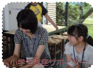
小学生講座サポーター

あつまれ！元気もんフェアのものづくりコーナーには、「立花中学校の生徒会」からサポーターとして参加します！どんなコーナーか、どうぞお楽しみに！おいなす八女で待っています！