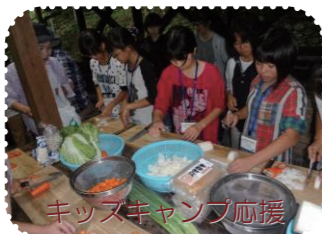
キッズキャンプ応援