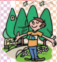
九州オルレを体験♪

平成27年7月25日(土)・26日(日) 福岡県立ふれあいの家南筑後で、八女市の6地区の講座生38人が集い、レクリエーションや食事作り、九州オルレ体験などで交流を深めました。