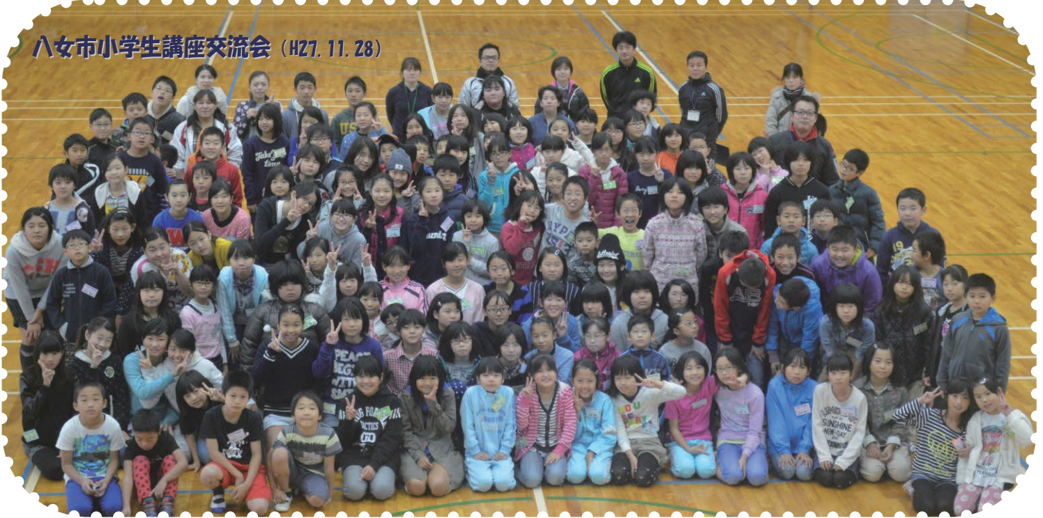
八女市小学生講座交流会 (H27. 11. 28)