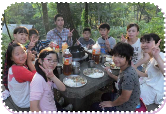
きらりやめっ子サマーキャンプ (in 長崎県諫早市)