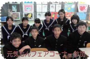
元気もんフェアコーナー参加

小学生講座のサポーターは、中高生から大人まで、いつでも募集中です！立花支所総務課までご一報ください！