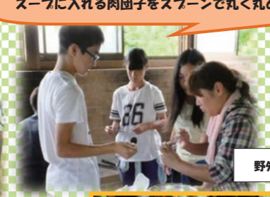
水餃子の皮を制作中!!