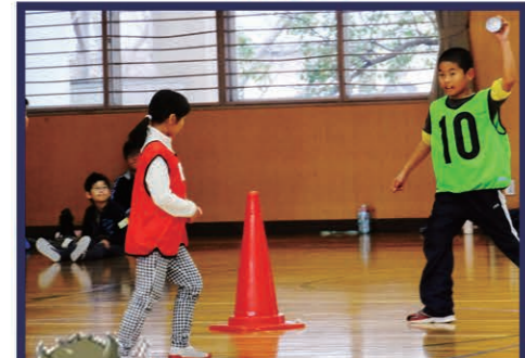
「スポーツ鬼ごっこ」