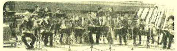
バンブーオーケストラ那珂川

2003年に結成された竹楽器のオーケストラ。メンバーは幼児から高齢者まで約30名で使用する楽器の殆どは地元の竹を切り出して団員自らが制作しています。今回は、打楽器の「竹べら」を作って一緒に演奏に挑戦します。参加希望の方はわらべ館へ予約をお願いします。