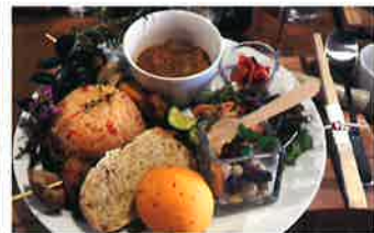
星のウィッチ ※写真はイメージです