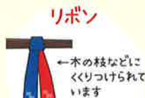
青と赤を結んだリボンはコースの目印です。