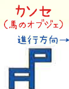
馬の頭が進行方向になります。