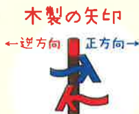
青の矢印は正方向、赤の矢印は逆方向です。“人”が通る道という意味が込められています