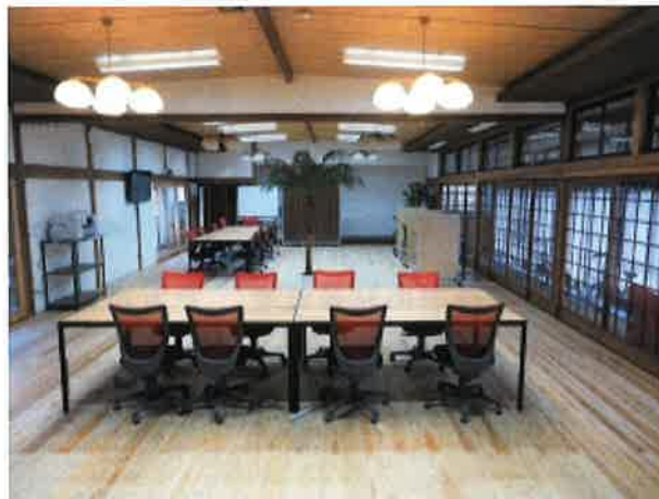
○大広間ステージより