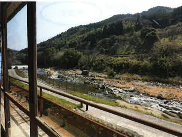
○施設からの風景（矢部川）