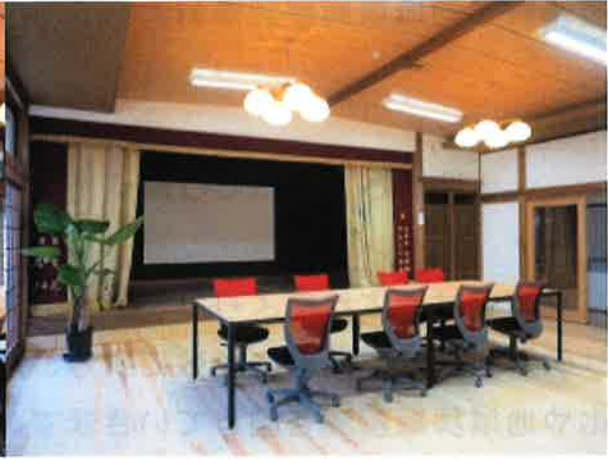
○オープンスペース