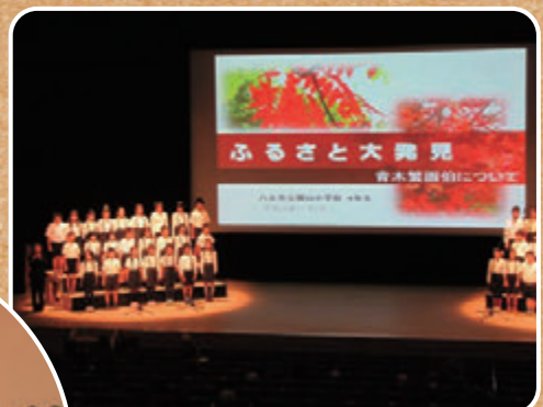
※昨年度の発表会の様子