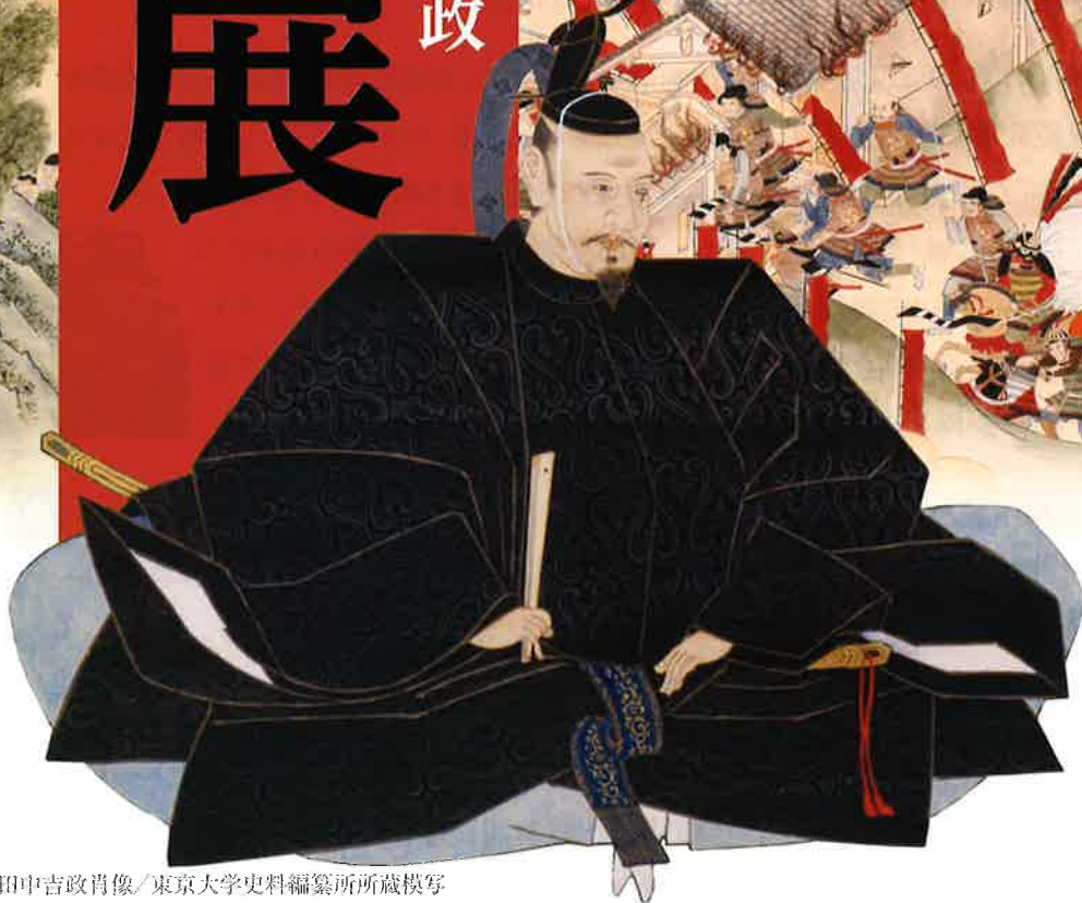
田中吉政肖像/東京大学史料編纂所所蔵模写