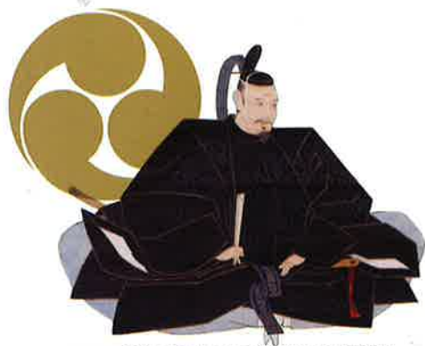
田中吉政肖像／東京大学史料編纂所蔵模写