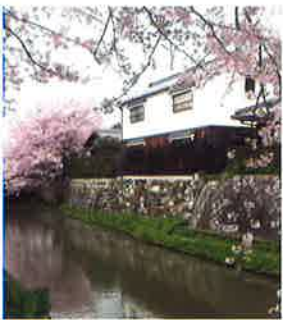
近江八幡市「八幡堀」

吉政は、織田・豊臣・徳川と続く戦国時代末期の激動の時代、豊臣秀吉の重臣中の重臣として見事に生き抜き、慶長5年(1600)関が原の戦いで石田三成を捕縛した功により、初代筑後国主32万5千石の大名として柳川城に入りました。当時の福岡県は、筑前「黒田家」と豊前「細川家」と筑後「田中家」によって治められていました。八女の福島城は、矢部川から水を引き入れ三重の堀(総郭型構造)を巡らせ、そこに侍屋敷、寺院、町屋、職人町を形成しました。また、大川(有明海)までの23Kmに及ぶ人工の運河「花宗川」を整備し、船運を利用した流通経済を発展させ、商人や職人たちが集う筑後一賑わう町としました。