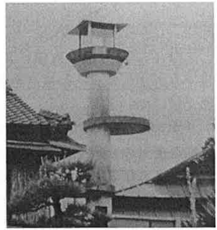
1995年まで灯し続けた平和の塔