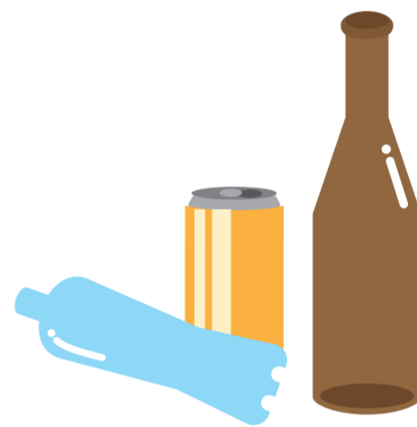
屋外に放置された空きビン・缶・ペットボトル